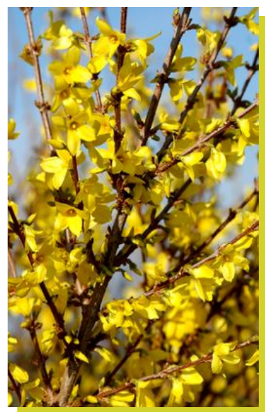
Forsythia x intermedia