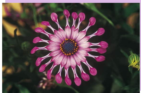
Osteospermum Astra "Pink Spoon"