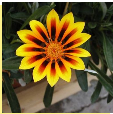
Gazania "New Magic"