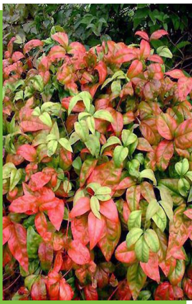
Nandina domestica 'FirePower'