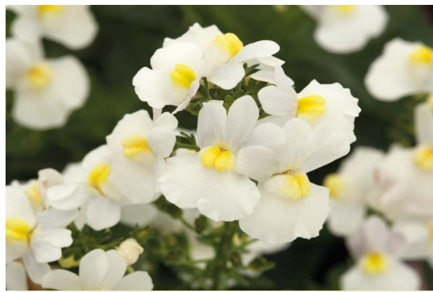
Nemesia Sunpeddle "White Perfume"