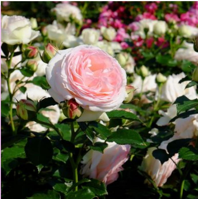
Pierre de Ronsard ® Meiviolin