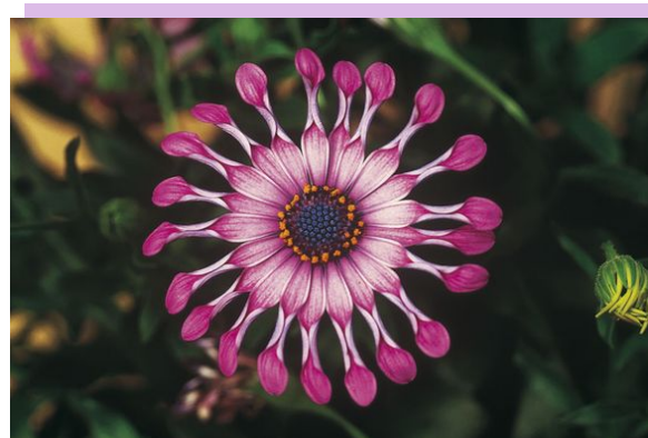
Osteospermum Astra "Pink Spoon"