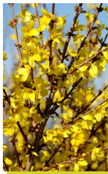
Forsythia x intermedia