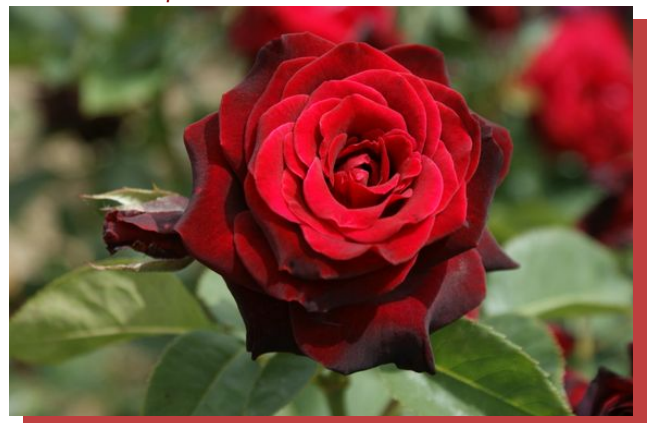
Black BACCARA ® Meidebenne