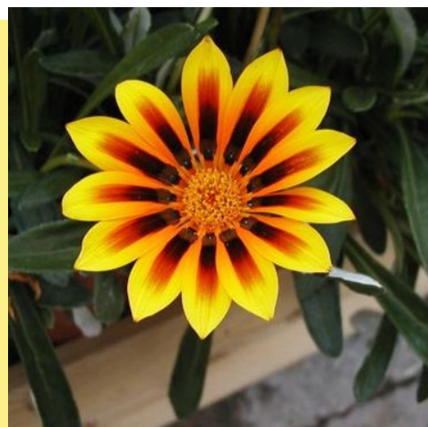
Gazania "New Magic"