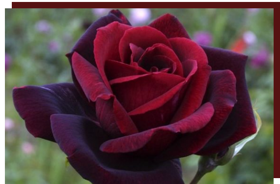
Papa Meilland ® Meicesar