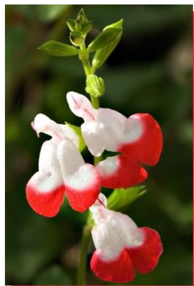
Salvia Grahamii 'Hot Lips'

Merci d'indiquer la quantité et le prix total pour chaque catégories de végétaux.