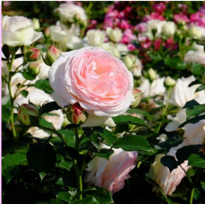
Pierre de Ronsard ® Meiviolin