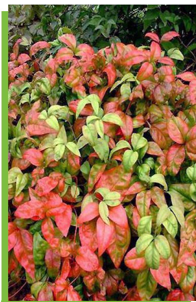
Nandina domestica 'FirePower'