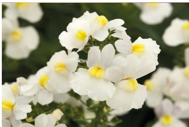
Nemesia Sunpeddle "White Perfume"